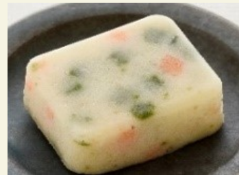
ほうれん草の 白和えムース