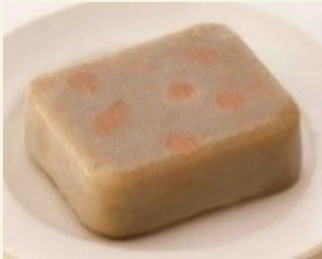
金平ごぼう ムース