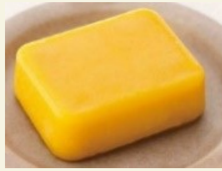
かぼちゃの 含め煮ムース