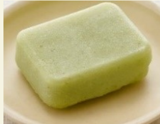
キャベツの 梅和えムース