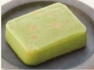
いんげんの ごま和えムース