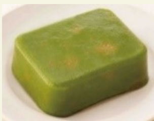
小松菜の 煮びたしムース