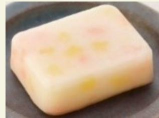
ポテトサラダ ムース